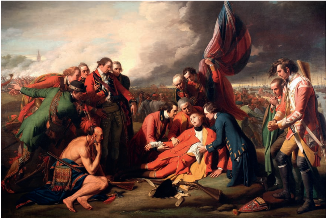
Peinture célèbre de la bataille de Québec (1759) – un tournant dans la conscience historique des Franco-Québécois, avec une référence forte à la conquête du Canada par les Britanniques.

La mort du Général Wolfe / The Death of General Wolfe, de Benjamin West, 1770. Peinture à l'huile sur toile de style néoclassique