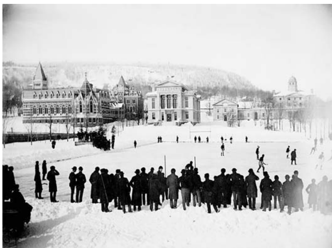
Une institution historique et centrale de la communauté anglo-québécoise, l'Université McGill.

Afin d'optimiser leur fonction pédagogique, ces modèles serviraient de tremplin aux élèves dans la production de récits d'appartenance personnalisés, appuyés sur des arguments développés de manière rationnelle et fondés sur des preuves historiques valides et fiables. Ils devront aussi permettre une compréhension de la conscience historique afin de mieux justifier les affirmations qui en émergeront. Ainsi, nous croyons que les modèles narratifs de type schématique ont le potentiel d'informer l'esprit communautaire des membres du groupe sur leur attachement au Québec et leur position sociale à titre de citoyens. Idéalement, ces modèles pourraient garnir les boîtes à outils culturelles des membres de la communauté, pour donner un sens à leur réalité sociale et influencer le fonctionnement de leur conscience historique.