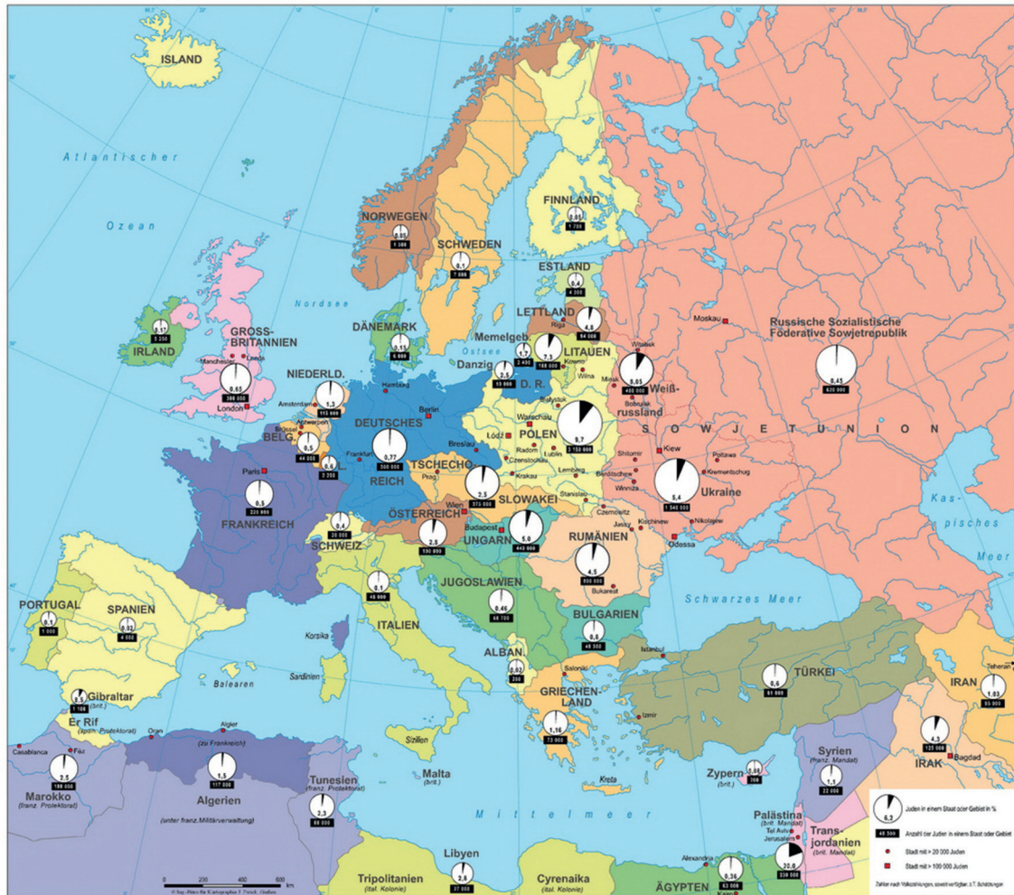
Abb. 1 : Jüdische Bevölkerung in Europa 1933