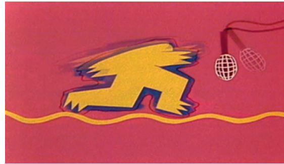
Standbild aus dem Intro der Sendung «Seismo Nachtschicht» von «SF DRS», 1987-1992.