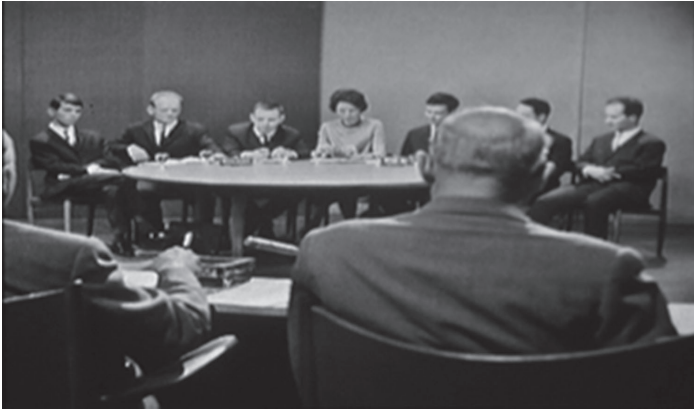
Standbild aus dem Gespräch zwischen Vertretern der Fraktionen und einer Abordnung der schweizerischen Jugendparlamente des «Schweizer Fernsehens», 21.10.1963. Blick über die Schultern der Fraktionsvertreter auf die Abgeordneten der Jugendparlamente.

Deutschschweizer Fernsehens respektive der «SRG» («Schweizerische Radio- und Fernsehgesellschaft») konnten in einem zweiten Schritt Veränderungen von Gesprächspraktiken und -idealen nachvollzogen werden. Schliesslich wurde der Wandel unter Beizug der Erkenntnisse der kulturhistorischen Forschung zu Jugendkonzepten und Gesprächsidealen 19 als Konjunktur einer Utopie gedeutet.