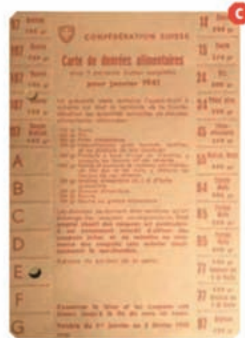
CARTE DE RATIONNEMENT, 1941.