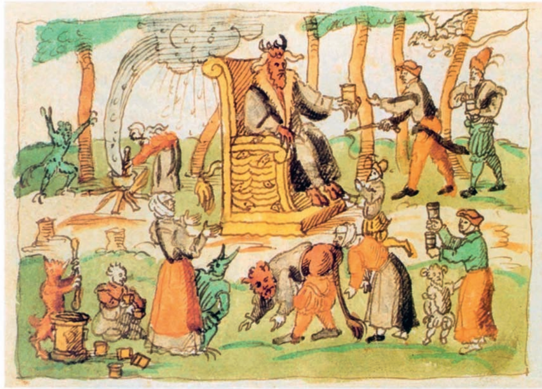
1 « Le diable au sabbat à Genève », Johann Jakob Wick, Wickiana , dessin, XVI e siècle.